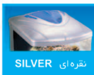
نقره ای SILVER